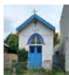
Wezembeek-Oppem Kapel OLV Vrede