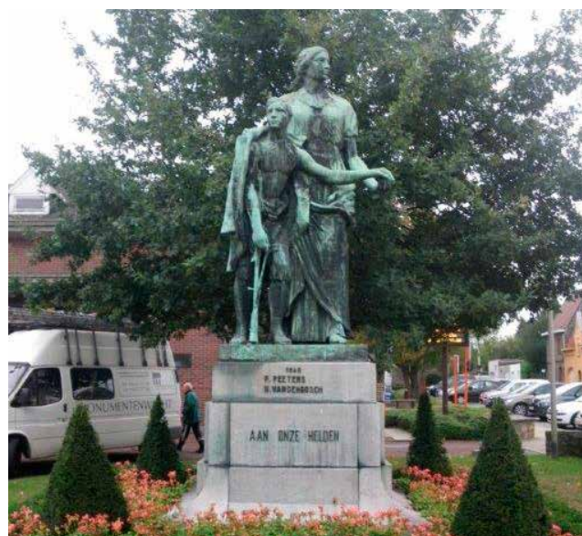
Oorlogsmonument - Beersel

Tip! Een handige ouder kan je klas helpen om het herinneringstekens te maken en plaatsen. Vergeet niet om toelating voor plaatsing te vragen bij gemeentebestuur en/of eigenaar.